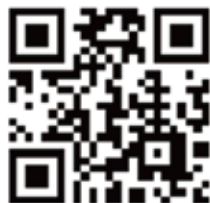
確定申告書等作成コーナー