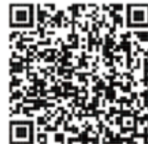
動画で見る確定申告