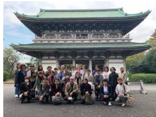
11/12 女性部日帰り研修旅行横浜方面

天候にも恵まれ、11月12日(火)曹洞宗大本山総持寺に参拝、横浜ラウンドマークタワー最上階でランチビュッフェに舌鼓、午後から横浜中華街を散策して帰宅しました