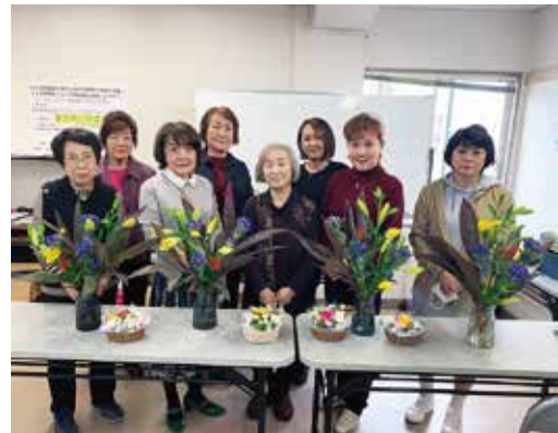
11/5 女性部フラワー講習会