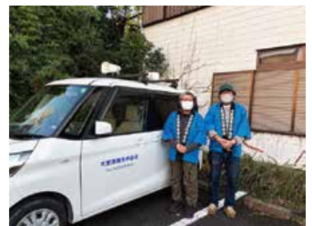
広報車 佐生ご夫妻