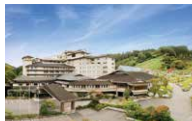
母畑温泉 『八幡屋』全景